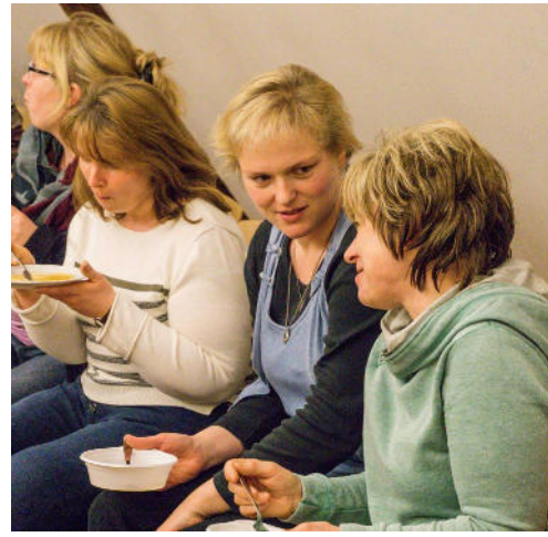
Weltgebetstag am 4. März 2016 in der Pfarrscheune Großbothen. Partnerland war in diesem Jahr Kuba. Nach den Landesinformationen und Gebet haben wir uns mit Landestypischem gestärkt.