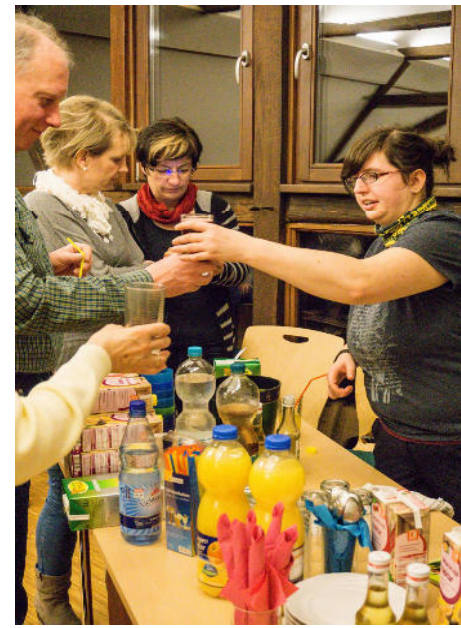
Frau Fritzschs alkoholfreie Cocktails kamen gut an.