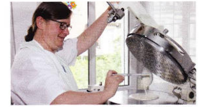
Backen der Hostienplatte

Nähere Informationen dazu in der Beilage zum Gemeindebrief, im Internet unter www.kirchentag.de oder r2017.org bzw. zeitnah in der Presse und im Fernsehen. Der große Abschlussgottesdienst auf den Elbwiesen Wittenbergs, bei dem etwa 100.000 Menschen erwartet werden, wird live im Fernsehen übertragen.