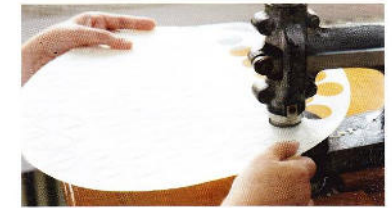
Ausstanzen der Hostien