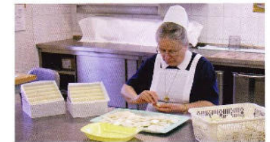
Einzählen und Gütekontrolle