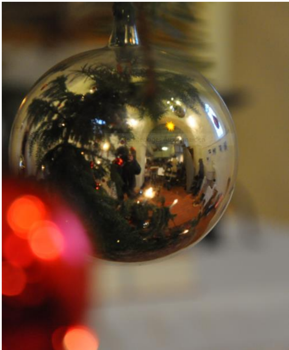
Heiliger Abend in Erdmannshain

der Ev.-Luth. Kirchgemeinden Naunhof, Klinga und Erdmannshain Dezember 2014 – Januar 2015