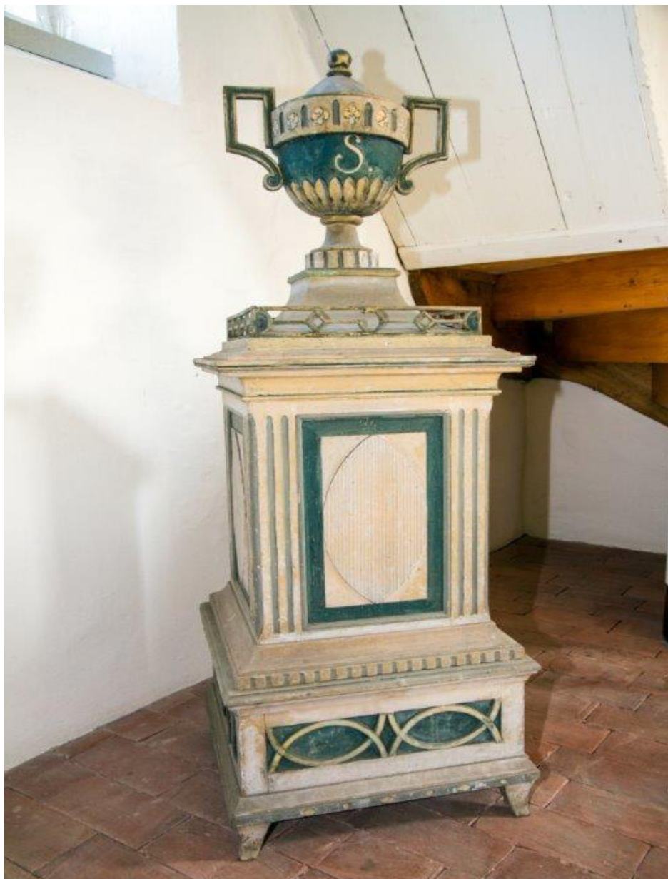
Altes Taufgestell Klinga

der Ev.-Luth. Kirchgemeinden Naunhof, Klinga und Erdmannshain Oktober – November 2016