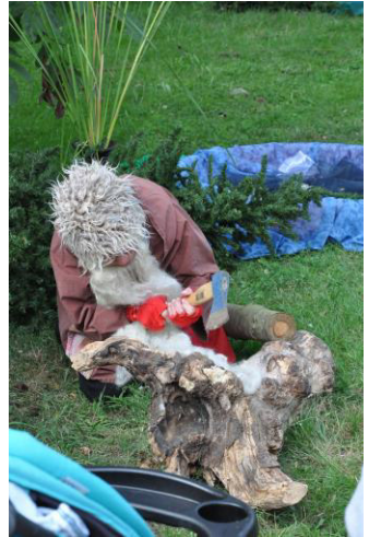
Gottesdienst zum Schulbeginn/Gemeindefest, 14.08. Naunhofer Theatergruppe zum Gemeindefest Kaffee-Trinken im Pfarrgarten zum Gemeindefest