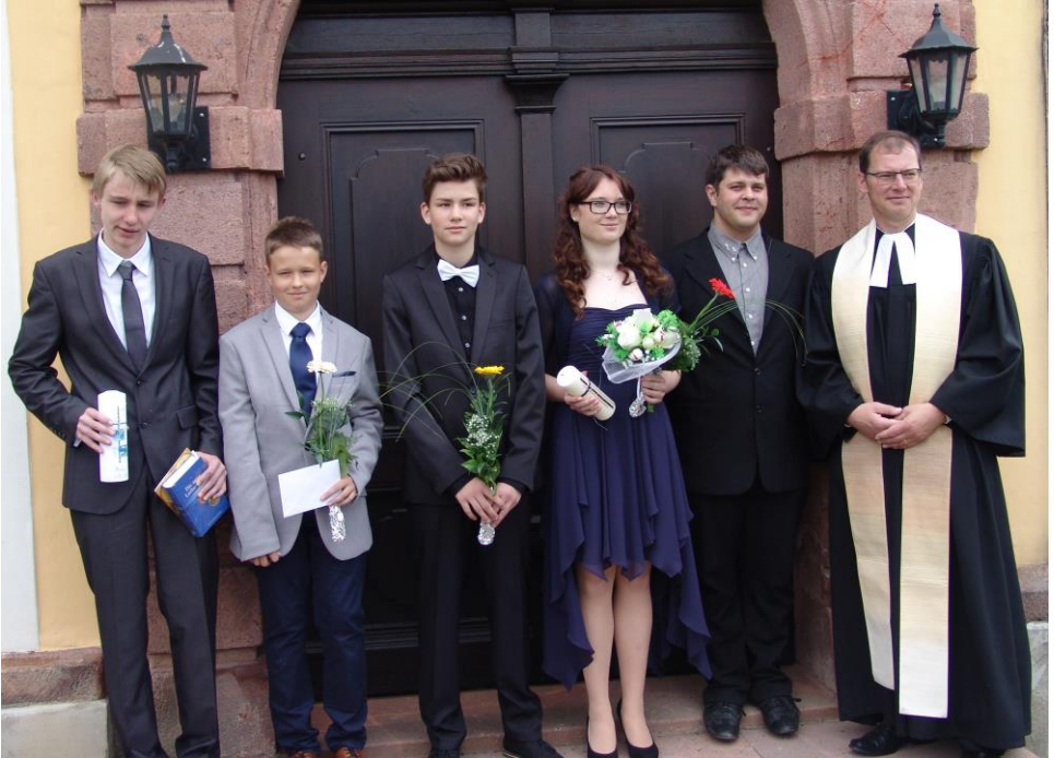
Konfirmation 2015 in Belgershain