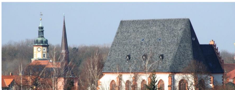
St. Marienkirche, erbaut um 1512 Orgel von Gottfried Silbermann, 1722