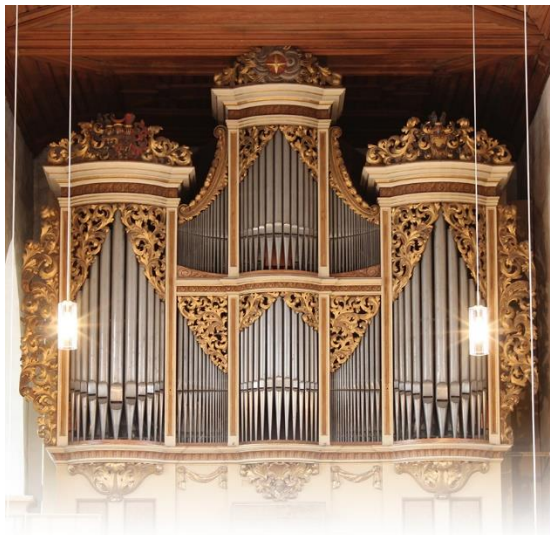
St. Georgenkirche, erbaut um 1150 Orgel von Gottfried Silbermann, 1721