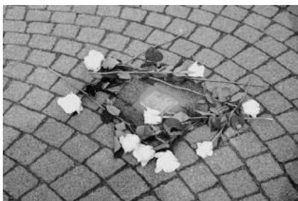
Stolperstein für Ilse Charlotte Flade in der Breitstraße

Stolpersteinaktion und Päckchen für Rumänien