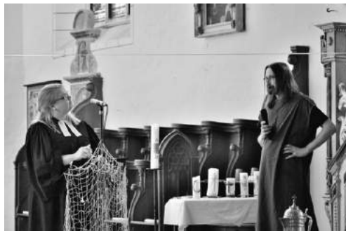
... und mit dem Apostel Petrus, der uns von seinen Abenteuern mit Jesus erzählte.