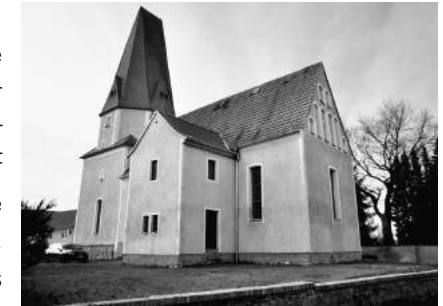
Stand lange ungenutzt: die Kreuzkirche

Nach umfangreichen Baumaßnahmen ist die Kreuzkirche in Elstertrebnitz zwar längst nicht fertig, aber nach Jahrzehnten immerhin wieder nutzbar. Dies beschränkt sich nicht allein auf Veranstaltungen unserer Kirchgemeinde. Die Kirche steht einer vielfältigen Nutzung offen, über die wir gerne mit den Elstertrebnitzern ins Gespräch kommen möchten.