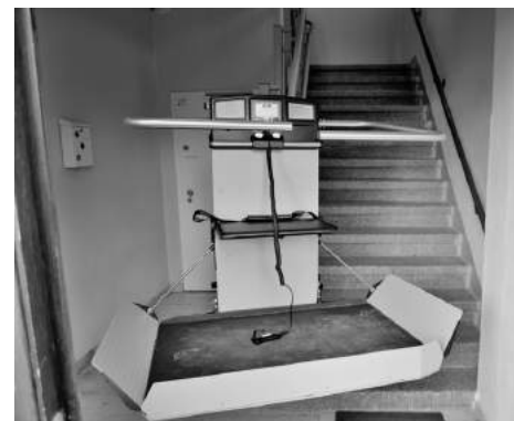
Dank moderner Technik sind Treppenstufen kein Hindernis mehr.

Die Treppe zu unserem Gemeindesaal im Lutherhaus ist nun mit einem modernen und sicheren Plattformlift ausgestattet. So können alle, denen das Treppensteigen schwerfällt, an unseren Veranstaltungen bequem teilnehmen. Auch Rollstuhlfahrer können bis zu einer gewissen Größe des Rollstuhls den Schrägaufzug nutzen. Einzig die Stufe an der Tür des Gemeindesaals muss dann noch überwunden werden. Vor der Benutzung des Aufzugs bedarf es allerdings einer kleinen Einweisung durch Pfarrer Reiprich bzw. Personen, die mit der Technik vertraut sind. Die Finanzierung des Treppenlifts erfolgte mit einer 100%-igen Förderung durch das sächsische Programm „Barrierefreies Bauen – Lieblingsplätze für alle“.