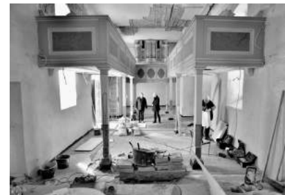
Blick in den Innenraum

Zunächst muss der Innenraum aber nach den Bauarbeiten gereinigt werden: Helfen Sie mit und kommen Sie zum Kirchenputz am Samstag, den 9. Oktober, 9.00 Uhr in die Kirche Trautzschen. Nutzen Sie diese Gelegenheit, die Kirche zu besichtigen. Bitte bringen Sie nach Möglichkeit Eimer, Lappen und Besen mit. Je mehr Leute zusammenkommen, desto mehr Freude macht es und umso schneller und besser gelingt es. Eine kurze Voranmeldung im Pfarramt hilft uns sehr (Tel. 034296 / 76464 oder Mail an kg.pegau@evlks.de ).