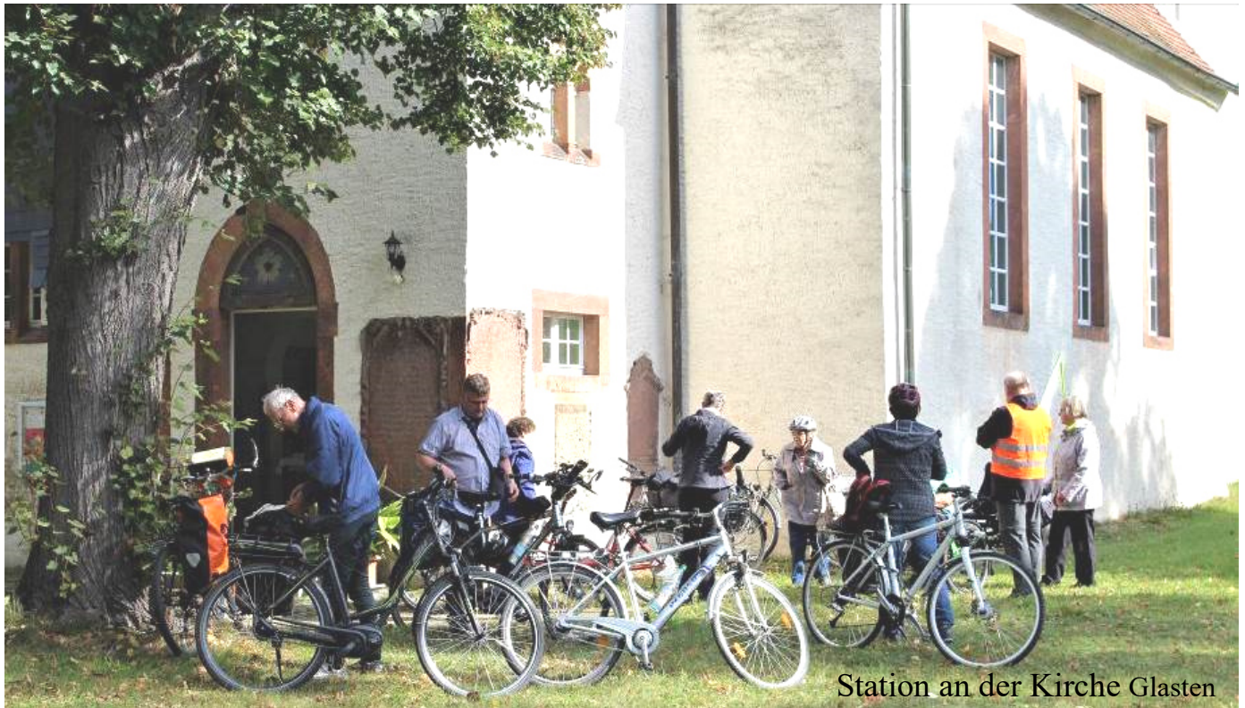
Station an der Kirche Glasten

Kennenlernen des Kirchspiels Muldental – Sie sind herzlich dazu eingeladen!