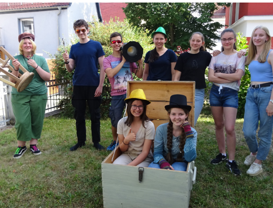
Foto: Theatergruppe Christoph Steinert, Bild kleiner Prinz Karl Rauch-Verlag