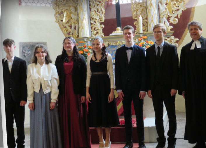
Konfirmation am 21. April in Brandis

Die Glocken im Brandiser Kirchturm wurden im April abgenommen und stehen zur Zeit auf dem Boden des Glockenstuhls. Die Stahljoche sind entfernt. Nun wird der Glockenstuhl repariert und neue Klöppel, Joche und Aufhängungen hergestellt und eingebaut.