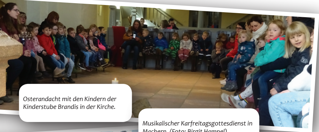
Osterandacht mit den Kindern der Kinderstube Brandis in der Kirche.