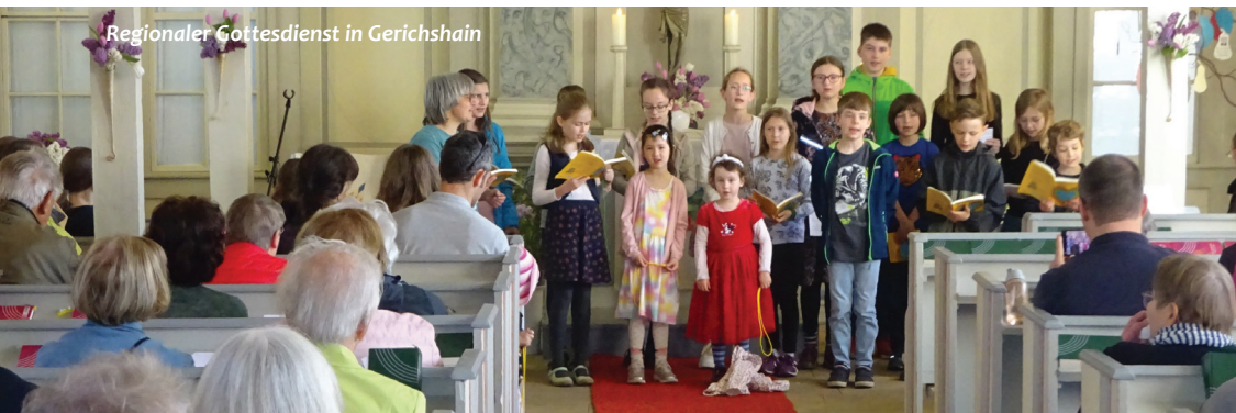
Regionaler Gottesdienst in Gerichshain