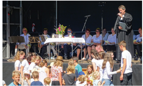
Gottesdienst im Stadtpark 2022

Zum Parkfest in Brandis am dritten Juni-Wochenende feiern wir unter dem Motto „hören“ einen besonderen Gottesdienst: Am Sonntag, 16. Juni, beginnt er 10:00 Uhr auf der Bühne im Stadtpark. Die Musik wird dabei nicht zu kurz kommen. Auch die Konfirmanden gestalten den Gottesdienst mit. Sollte es wider Erwarten regnen, ist die Stadtkirche nicht weit.