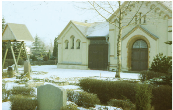
Friedhofsgebäude um 1980

Die Borsdorfer Friedhofskapelle wurde in den Jahren 1902 / 1903 nach Plänen des Leipziger Architekten Richard Füssel errichtet, 25 Jahre nach Inbetriebnahme des Friedhofs (Die Friedhofsweihe fand am 24. Juni 1877 statt).