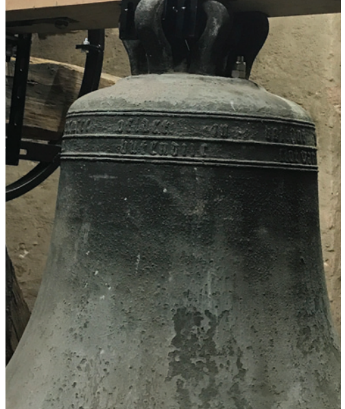
Die Größte unserer drei Glocken. Durch die Inschrift wissen wir, dass sie 1452 in Holland gegossen wurde.

Nun wurde die Taufglocke, sie ist die jüngste Glocke aus dem Jahr 1963, gefertigt in der Glockengießerei Apolda, für diese Aufgabe bestimmt. Ein spezielles Hammerwerk musste gefertigt werden. Zur vollen und halben Stunde werden wir im Tagesverlauf durch den Glockenschlag in „Fis“, an die Zeit erinnert.