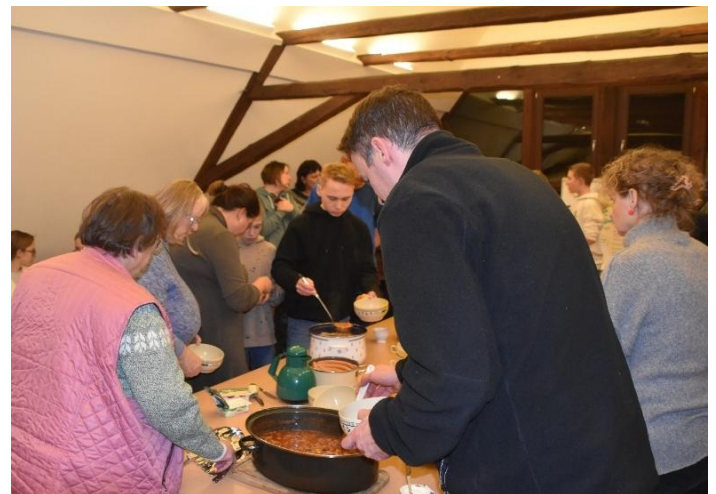
Bilder oben Bibelwoche in der Pfarrscheune Großbothen: Ein Mehrgenerationentreffen!