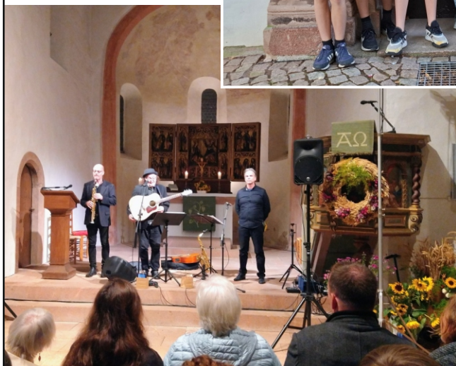
Gerhard Schöne Konzert