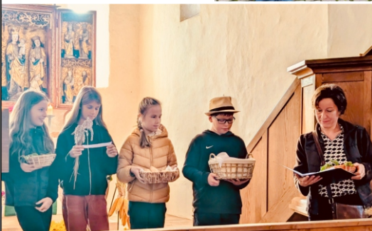
Erntedank in Etzoldshain