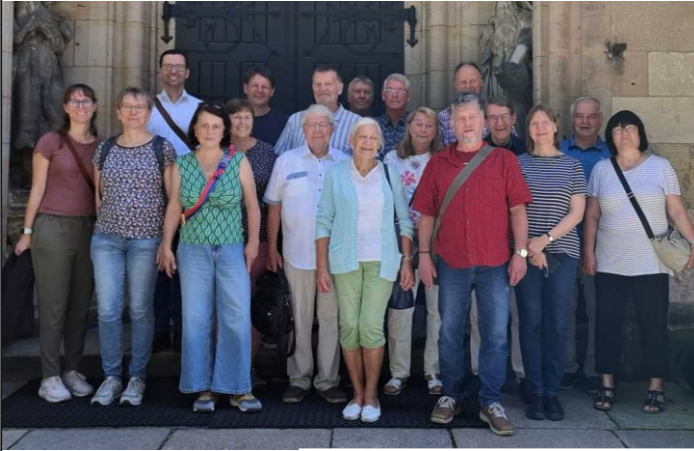
Ausflug des Fördervereins nach Chemnitz