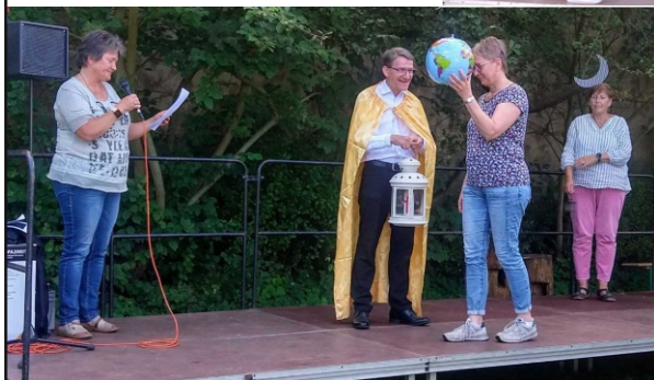
zum SKV-Tag in Deutzen