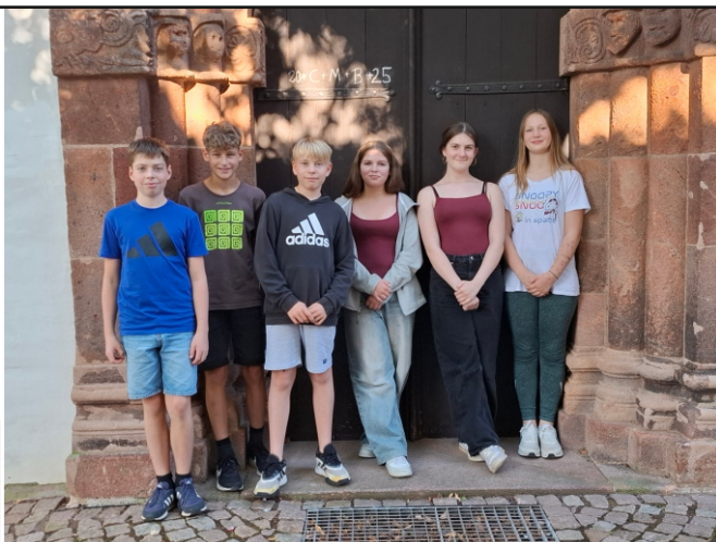
Die neuen Konfirmanden der Klasse 7