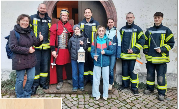
Die Lichtbringer aus Etzoldshain am Martinstag 2025