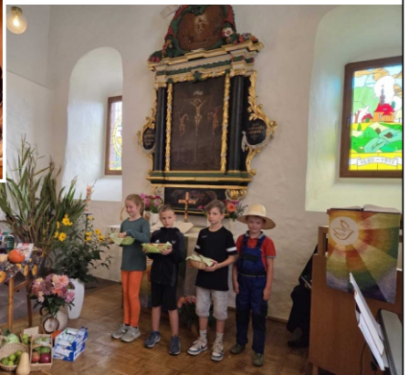
... und in Buchheim