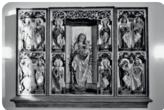
Marienaltar, Kirche Großstorkwitz