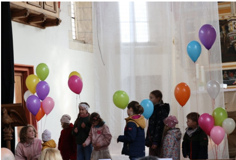
Familiengottesdienst zum Osterfest in Röttha