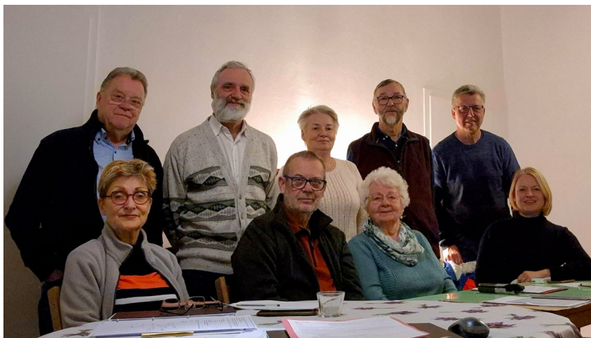
Gründung des Fördervereins Pfarrhaus Rötha am 07.01.2025

Wir könnten weitere Beispiele nennen, in denen die Kirchgemeinde und die Bürgerinnen und Bürger Röthas gemeinsam versucht haben, die Zeiten zu überstehen. Manches ist gelungen, aber auch Schuld und Versagen dürfen nicht vergessen werden.