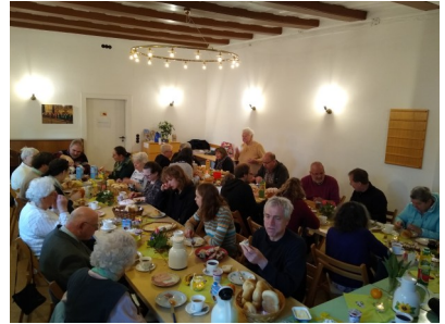
Familiengottesdienst und Osterfrühstück in Röttha