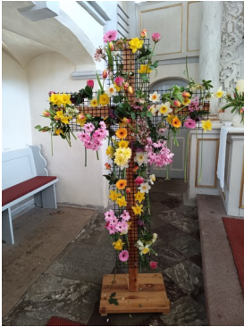
Blumenkreuz der Osternacht Eula und des Familiengottes- dienstes Kitzscher