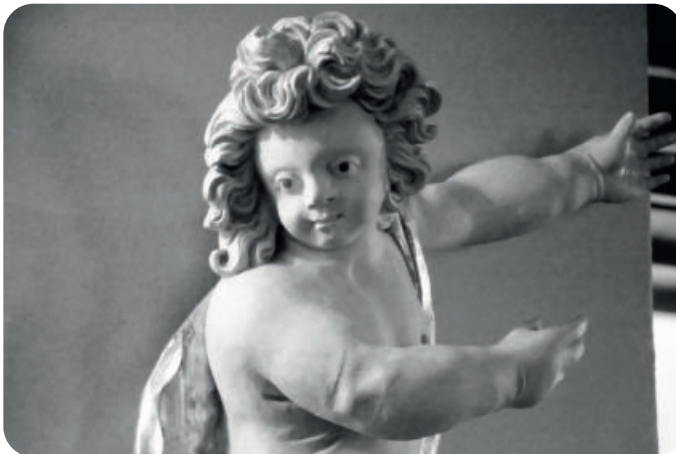
Frauenkirche Groitzsch – Engel

Audigast, 09:00 Uhr: Gottesdienst, Lektorin Eltزشig Pegau, 10:30 Uhr: Gottesdienst, Lektorin Eltزشig